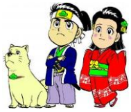
マツケン・松太郎・松姫