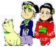
マツケン・松太郎・松姫